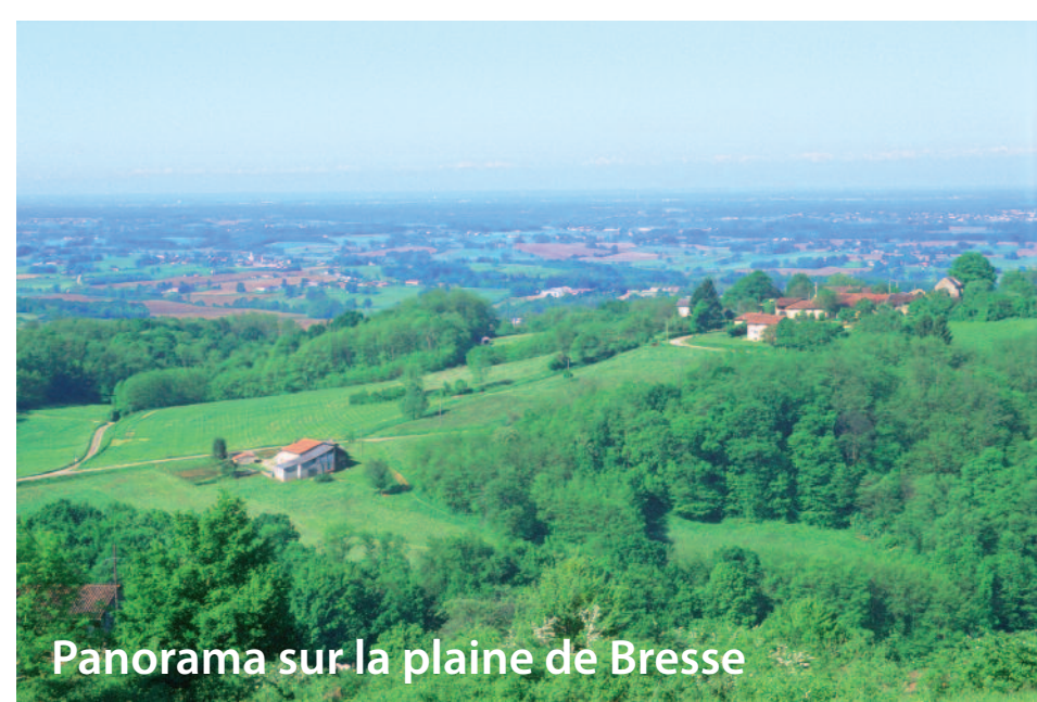
Panorama sur la plaine de Bresse