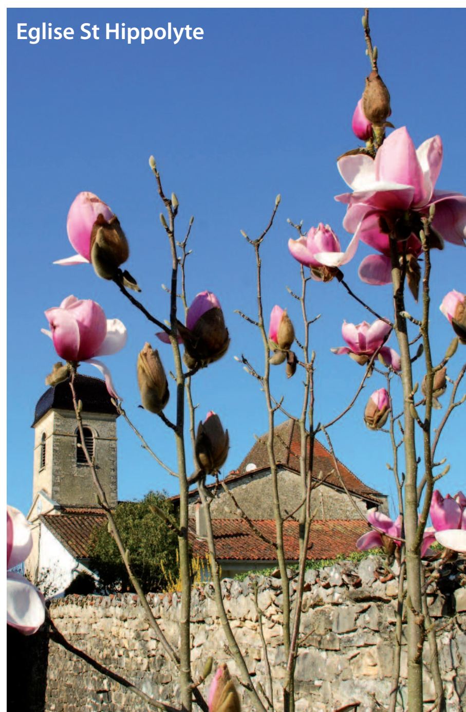
Eglise St Hippolyte