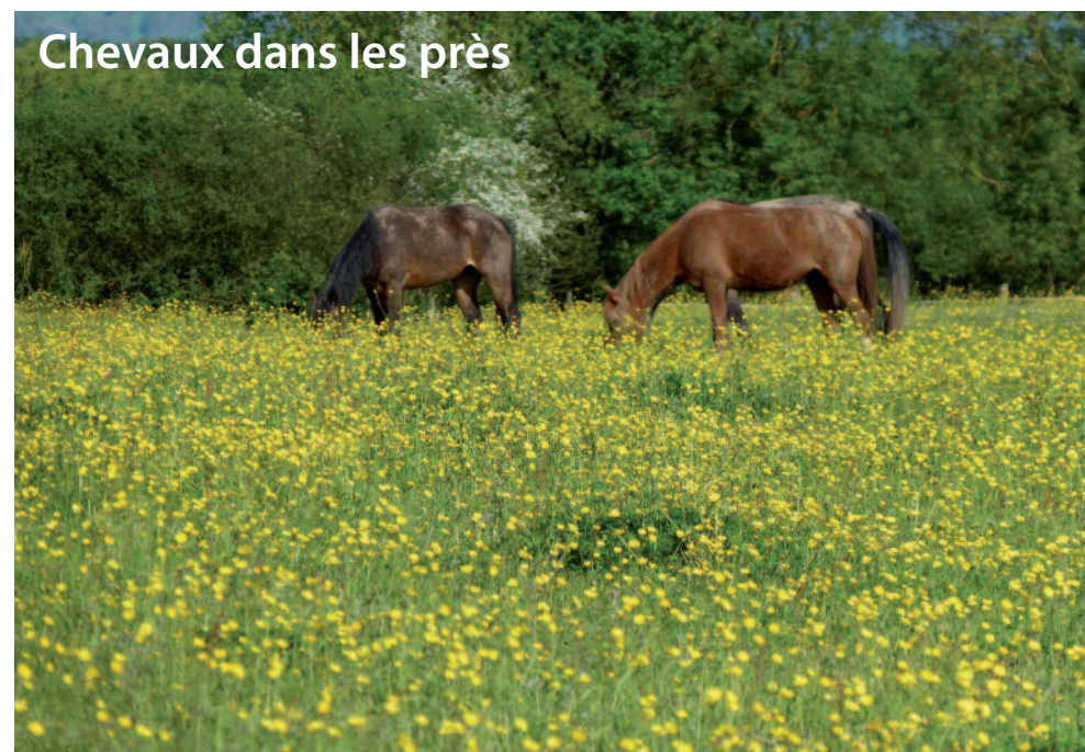
Chevaux dans les prés