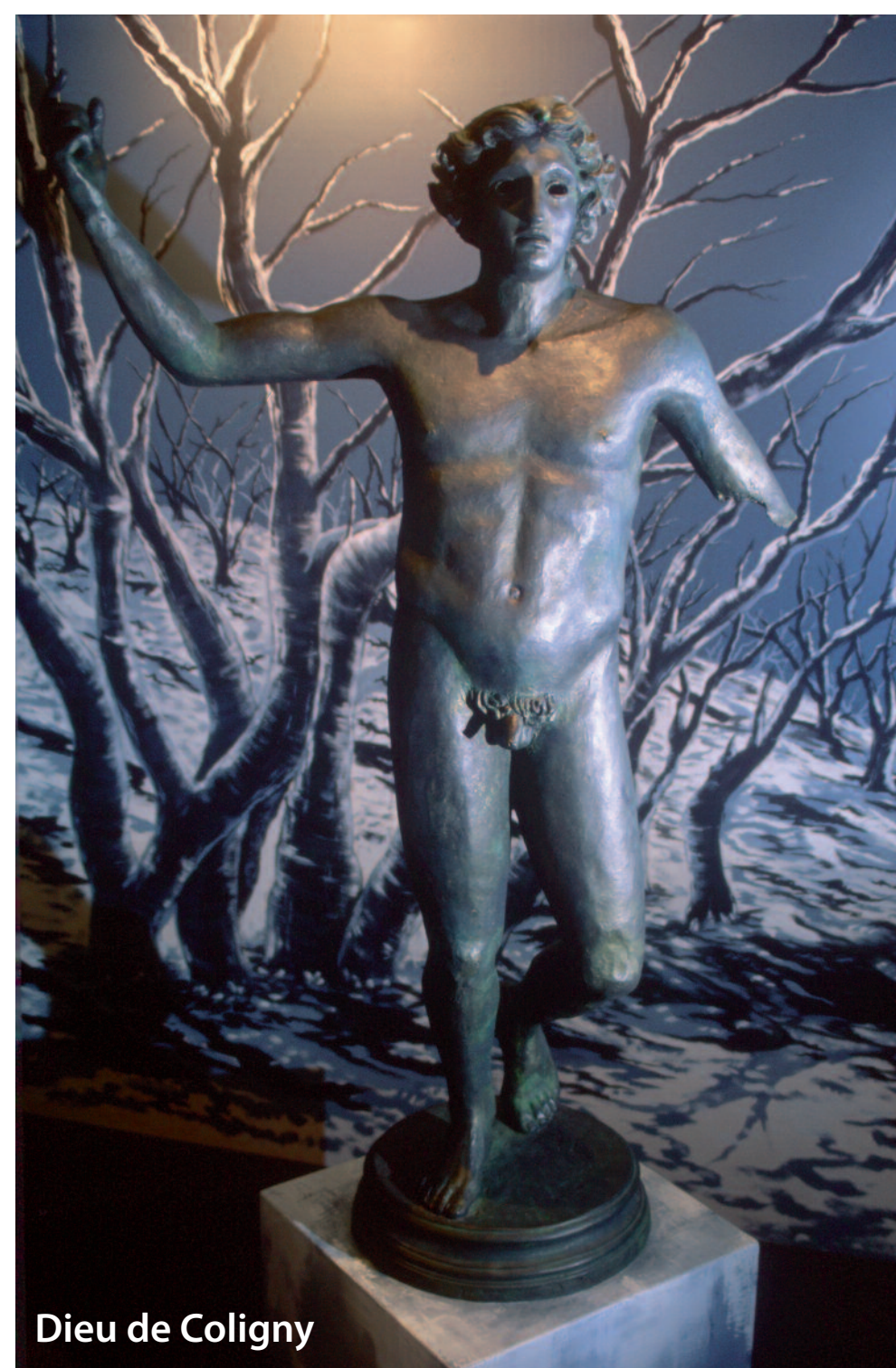
Dieu de Coligny