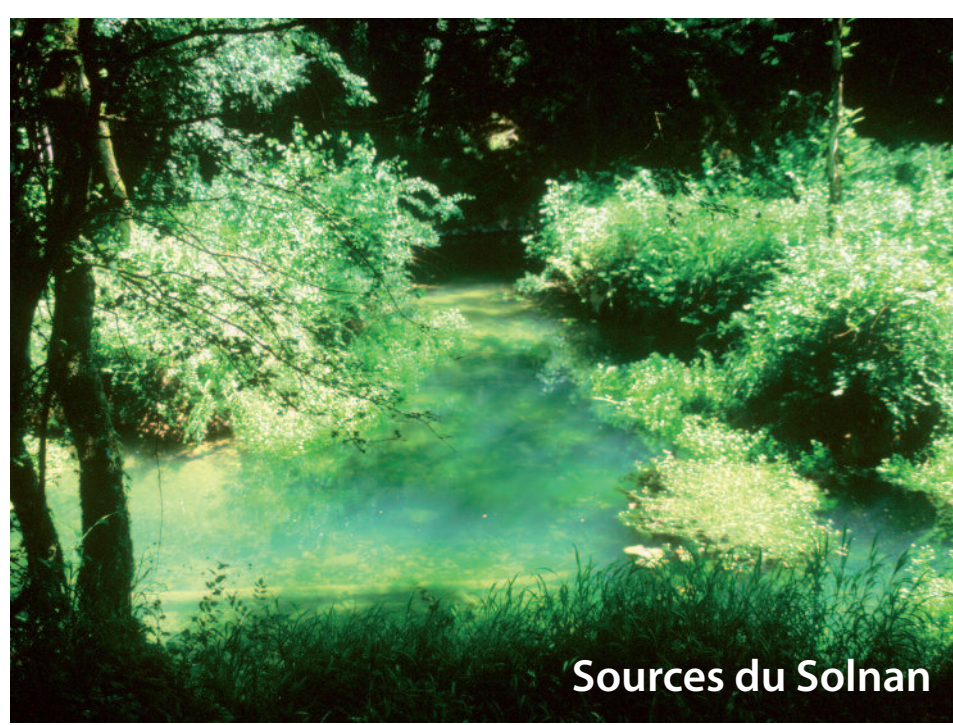
Sources du Solnan

Sur ce sentier, une variante est proposée aux plus courageux d'entre-vous pour un aller-retour au MONT VERJON, point culminant de la commune à 498 m d'altitude. Remarquables points de vue sur la plaine de la Bresse et le Mâconnais.