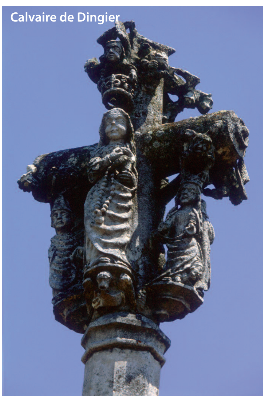
Calvaire de Dingier

Cette promenade, assez vallonnée, vous permettra de découvrir le charme et les caractéristiques d'un village revermontois blotti au creux de son vallon : SALAVRE. Son origine toponymique, controversée, proviendrait de l'hébreu « selaw » signifiant roche.