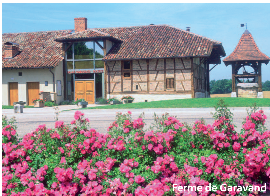
Ferme de Garavand

La ferme de GARAVAND transférée en 1996, suite à la construction de l'A 39, sert actuellement de mairie et de salle des fêtes. Ce bâtiment typique du XII e siècle, au centre du village, présente les caractéristiques de l'habitat bressan : pans de bois, carrons (appellation des briques dans la région), torchis. Outre le remarquable moulin merveilleusement conservé, le hameau de MARMONT recèle en ce lieu une bâtisse classée, récemment rénovée : Le MANOIR DE MARMONT. Il ne s'agit nullement d'une ferme mais bien d'une demeure noble, centre du fief de Marmont, possession du Duché de Bourgogne. Au début du XIX e siècle, le Manoir fut rabaissé au rang de simple ferme. Les bâtiments d'exploitation datent de 1840 et le corps original de 1434. Perché sur une petite butte, orienté Nord-Sud, sa façade la plus soignée est tournée vers le Revermont. Demeure imposante (31 m de long, 11 m de large, 10 m de haut), elle comporte un étage, signe de son origine seigneuriale. Possibilité de visite durant les Journées du Patrimoine et en juillet (sous réserve).