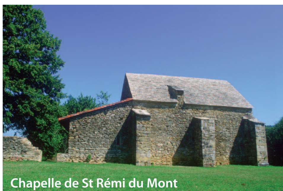
Chapelle de St Rémi du Mont