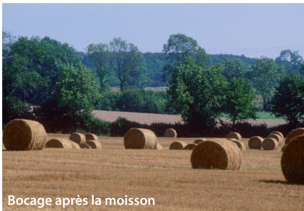
Bocage après la moisson

Au cours de votre promenade, vous rencontrerez certainement cavalières, cavaliers et attelages de la très dynamique société « Les Amis du Cheval ». On remarquera le fort impact de l'ACTIVITÉ ÉQUESTRE sur le territoire : élevages de chevaux comtois, écuries, parcs à chevaux ainsi que de nombreuses manifestations tout au long de l'année.