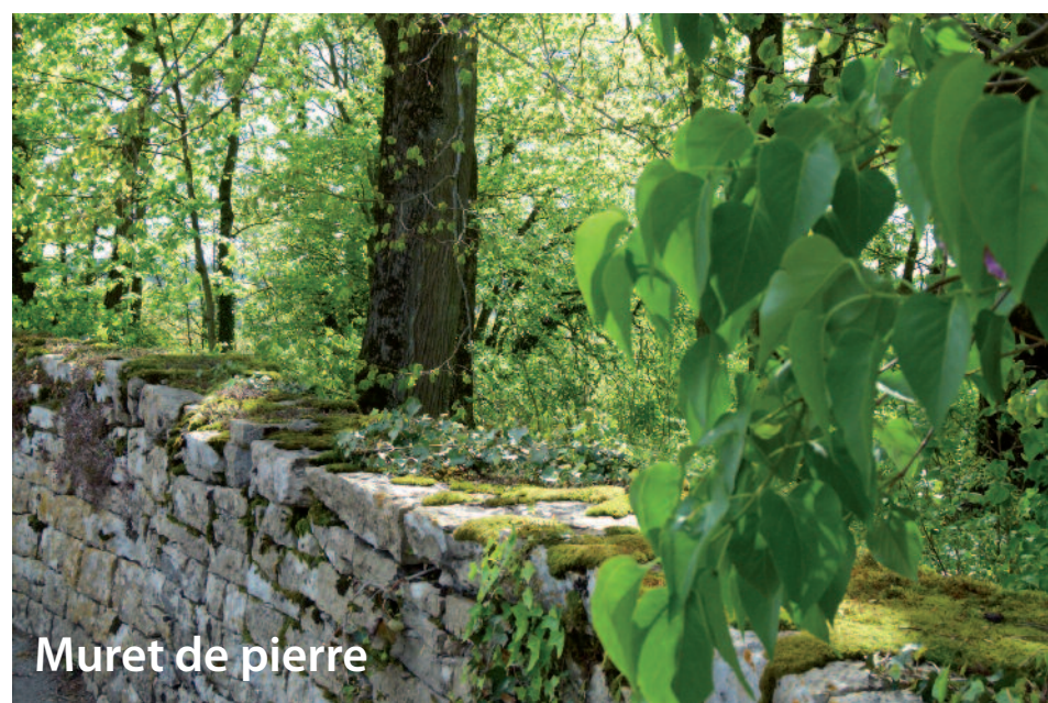
Muret de pierre