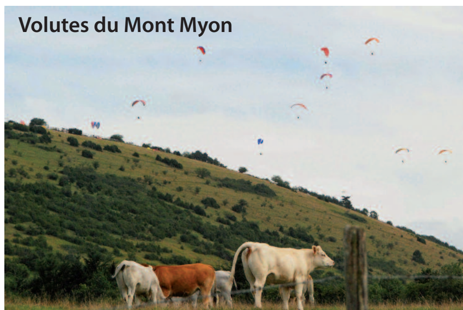
Volutes du Mont Myon