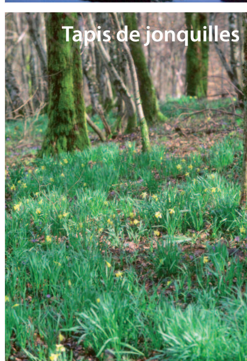
Tapis de jonquilles