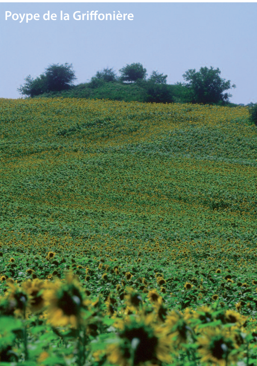
Poype de la Griffonnière

Entre levant et couchant, VILLEMOTIER, adossée à l'Est au Revermont, se prolonge à l'Ouest par le plateau bressan.